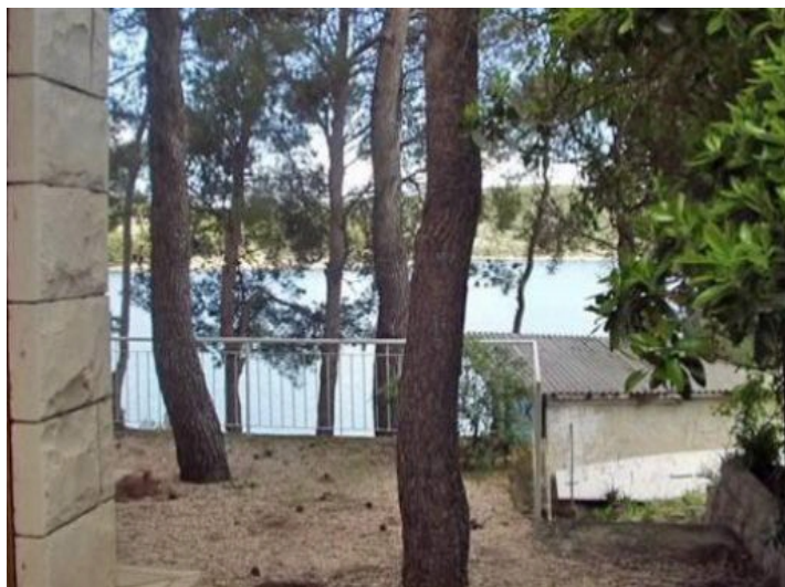
Von Pinenbäumen umgeben