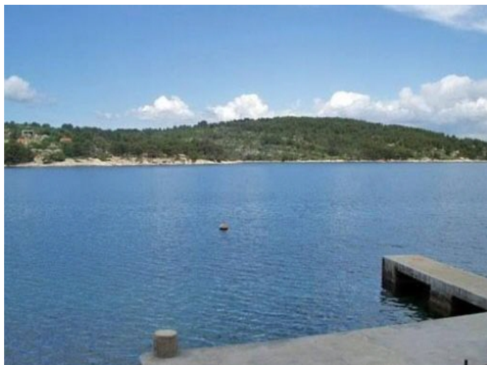
Herrlicher Ausblick auf das Meer